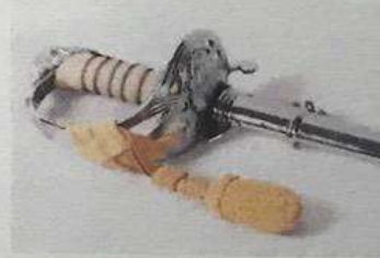
พู่กระบี่