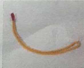
สายหลักสูตร ฝ่ายอำนวยการ