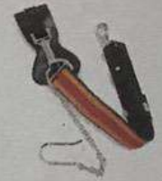
สายกระบี่