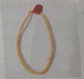
สายนายเวร ชุดปกติ