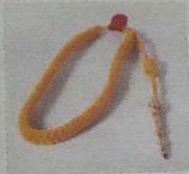
สายนายเวรชุดขาว/คอแบะ